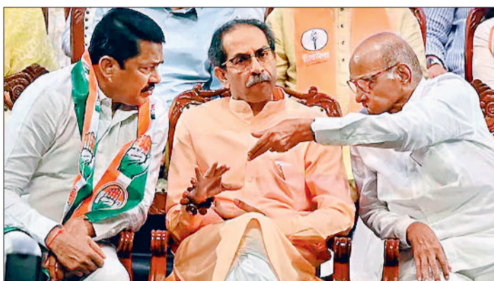
कांग्रेस का भी इन्हीं 12 सीटों पर दावा