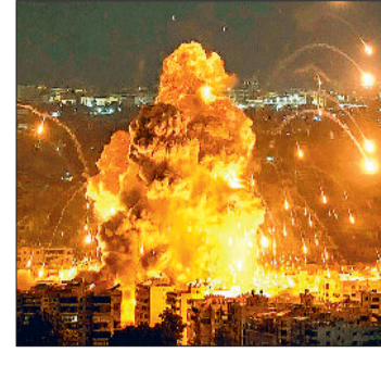
रिपोर्ट की जांच कर रहा है सैकड़ों टन बारूद झेल चुके गाजा में जमीन से लेकर आसमान तक सिर्फ और सिर्फ तबाही की तस्वीरें नजर आती हैं। जंग की त्रासदी झेल रहे लोगों की जिंदगी बमबारी के बीच गुजर रही है। जान बचाने के लिए लोग इधर-उधर भाग रहे हैं।

एजेसी ►► तेल अवीव गाजा पट्टी के बेत लाहिया इलाके में इजरायल ने बड़ा हमला किया है। इस हमले में कम से कम 73 फिलिस्तीनी मारे गए हैं। मरने वालों में ज्यादातर महिलाएं और बच्चे हैं। न्यूज एजेंसी रॉयटर्स के मुताबिक ये हमला शनिवार देर रात बम विस्फोट के जरिए किया गया। इस हमले के बाद कई लोगों के मलबे में दबे होने की बात कही जा रही है। हमसा का कहना है कि इजरायल ने अपने इस ताजा हमले में 'भीड़भाड़ वाली जगह को निशाना बनाया है। फिलिस्तीनी समाचार एजेंसी वफा के अनुसार इजरायली हमलों में एक पूरा आवासीय परिसर ही नष्ट हो गया है। वहीं इस हमले को लेकर इजरायल का कहना है कि वह इससे जुड़ी