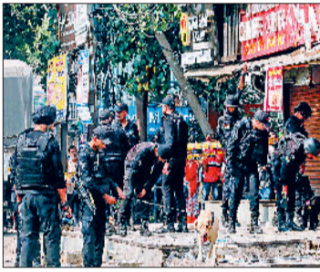
(एनएसजी) के अधिकारी भी मौके पर पहुंच गए। इसकी विस्तृत रिपोर्ट जल्द ही गृह मंत्रालय को सौंपी जाएगी। अभी तक हुई जांच में सामने आया है कि इस ब्लास्ट के लिए काफी ज्यादा मात्रा में विस्फोटक का इस्तेमाल किया गया था। इस धमाके की आवाज दो किलोमीटर तक सुनाई दी थी।

हरिभूमि न्यूज ►► नई दिल्ली दिवाली से पहले दिल्ली दहलाने की बड़ी साजिश नाकाम हो गई। दिल्ली के रोहिणी में सीआरपीएफ स्कूल के पास रविवार सुबह करीब 7.50 बजे एनआई और एनएसजी की टीम पहुंची जोरदार धमाका हुआ। घटनास्थल का निरीक्षण कर रहे फोरेंसिक एक्सपर्ट्स ने सफेद पाउडर बरामद किया है, जिसे जांच के लिए लैब में भेजा गया है। स्कूल की दीवार के पास एक गड्ढा खोदकर मिट्टी के नमूने भी लिए गए हैं। इस धमाके की जांच के लिए दिल्ली पुलिस बम निरोधक दस्ते और फोरेंसिक टीम सहित तुरंत घटनास्थल पर पहुंच गईं। इसके साथ ही राष्ट्रीय जांच एजेंसी (एनआईए) और राष्ट्रीय सुरक्षा गार्ड